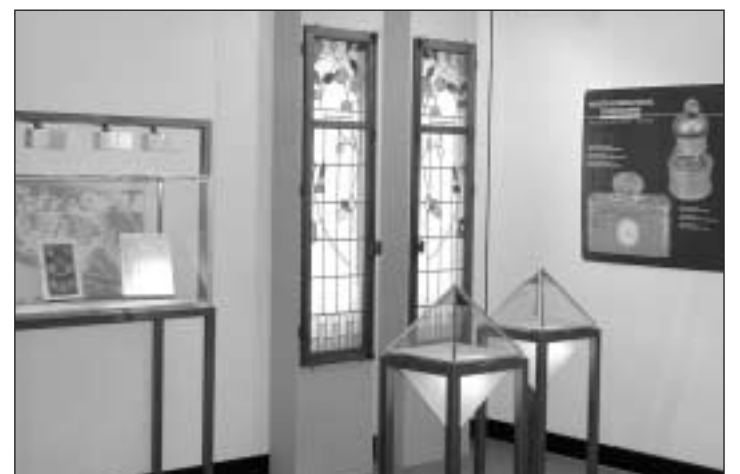
Le stand du MIH tel qu'il sera présenté à Genève.

gurant l'organisation d'une année Art nouveau en 2005 à La Chaux-de-Fonds, le MIH propose une exposition montrant l'utilisation de ce courant stylistique dans la décoration des montres et pendules produites vers 1900, ainsi que dans la publicité horlogère de l'époque. /comm-réd