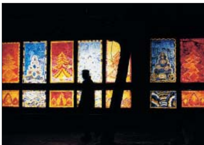
Vitraux inspirés de dessins d'André Evard à Numa-Droz.