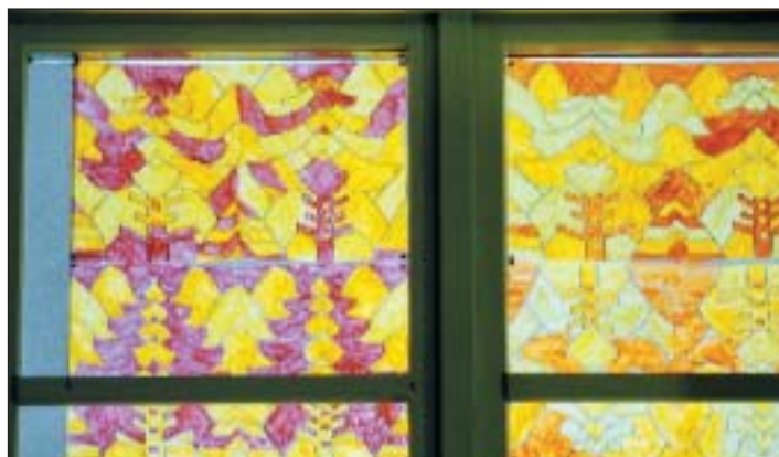
En haut, collège des Marronniers; en bas, Cernil-Antoine.