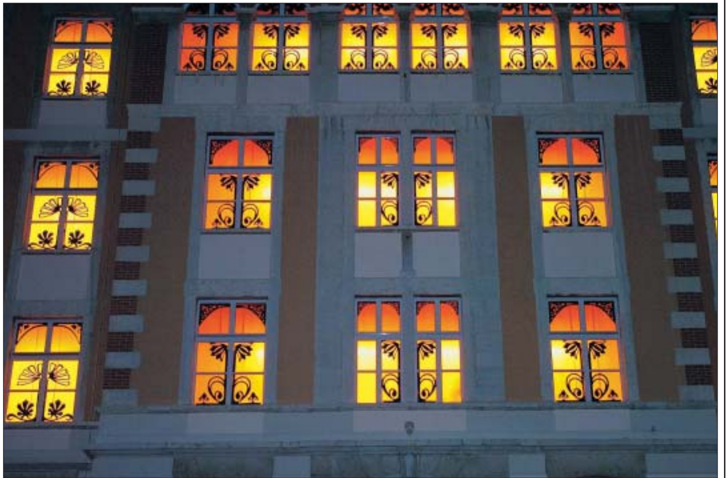
Au collège de la Charrière, toutes les fenêtres sont ornées de motifs floraux stylisés en découpes.