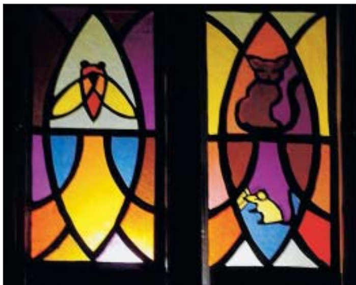
Une abeille chaux-de-fonnière au collège du Bas-Monsieur.