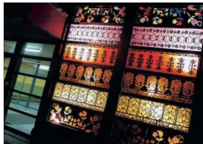
Une entrée majestueuse pour le collège des Foulets.