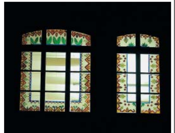
Des frises d'époque au collège de l'Ouest.