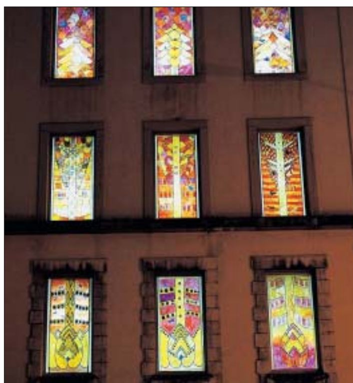
Dans la ligne du Style sapin propre à La Chaux-de-Fonds.