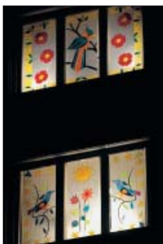
Collège des Endroits.