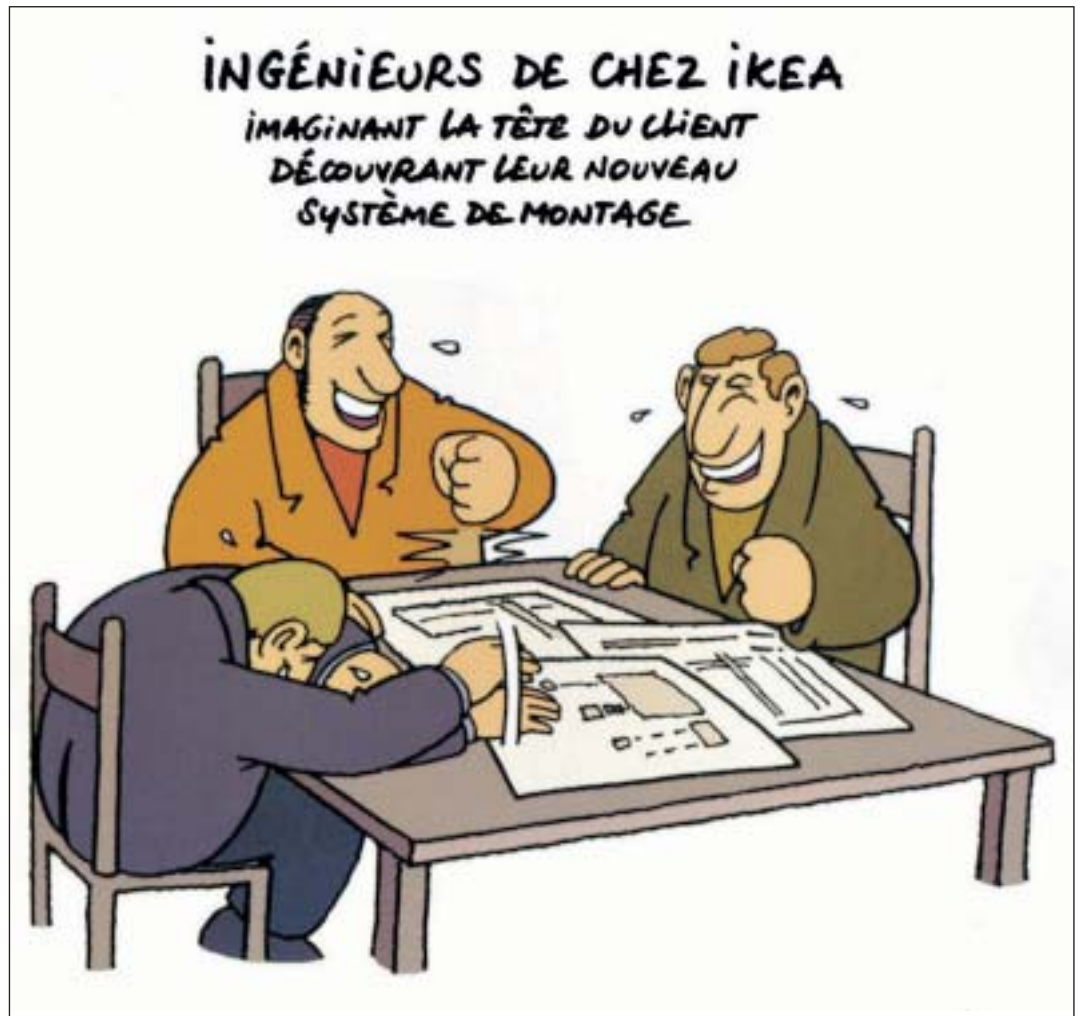
Bien que très large d'épaules, le Chat n'est pas le seul à occuper l'espace dans le dernier album de Philippe Geluck. DOCUMENT SP

Geluck, en revanche, avec trois ou quatre gags par page, sature l'espace à disposition et comble son lecteur, même si tout n'est de loin pas du même niveau. Mais il est difficile de résister à la puissance de feu de cet auteur qui multiplie les