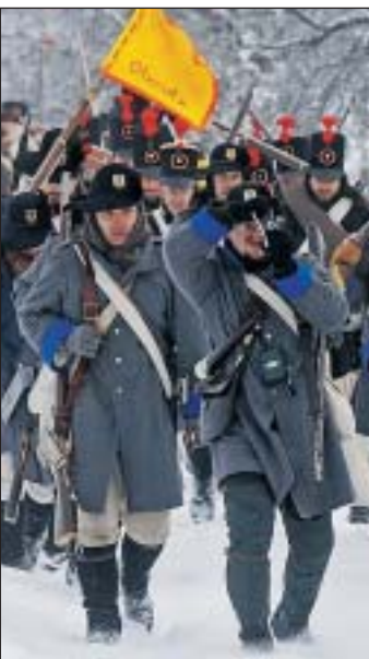
Une photo souvenir avant la bataille...

Des régiments de volontaires venus de toute l'Europe ont revêtu, samedi à Slavkov (République tchèque), la bataille d'Austerlitz devant des dizaines de milliers de spectateurs. Il s'agissait du plus grand spectacle historique napoléonien jamais organisé de mémoire de grognards.