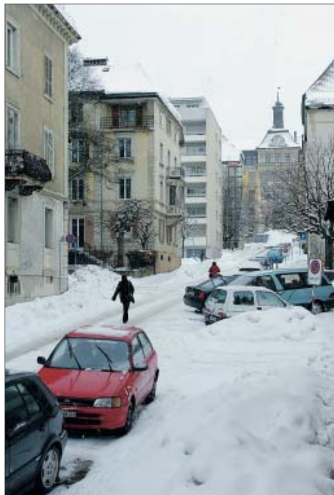
Du mois d'avril au mois de juillet, la rue du Collège-Industriel sera fermée au trafic. PHOTO GALLEY

Un essai qui va dans le sens voulu par les autorités, pour lesquelles rien n'est irréversible. Alors, comme dit le dictionnaire anglais, «wait and see» (attendre et voir). /dad