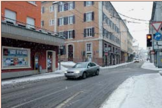
De la rue de la Balance, les véhicules pourront rejoindre l'Hôtel-de-Ville et Fritz-Courvoisier. PHOTO GALLEY

Parmi les projets qui seront mis en consultation, il y a le changement de la rue de la Balance. Quel est l'objectif visé? «L'idée est partie de deux nécessités: limiter le trafic sur la rue Neuve et autour de la Grande Fontaine pour rendre ces espaces aux clients des commerces; désengorger le carrefour pour les bus qui viennent de la Charrière», répond Laurent Kurth.