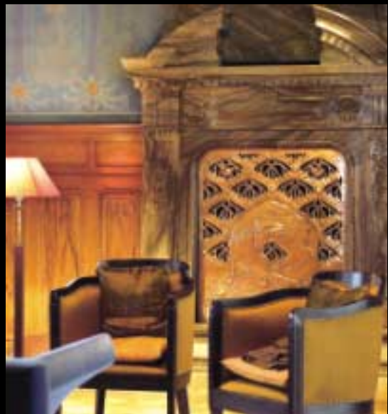
Renard ou loup? Le doute subsiste et la cheminée est en fait un simple cache-radiateur.