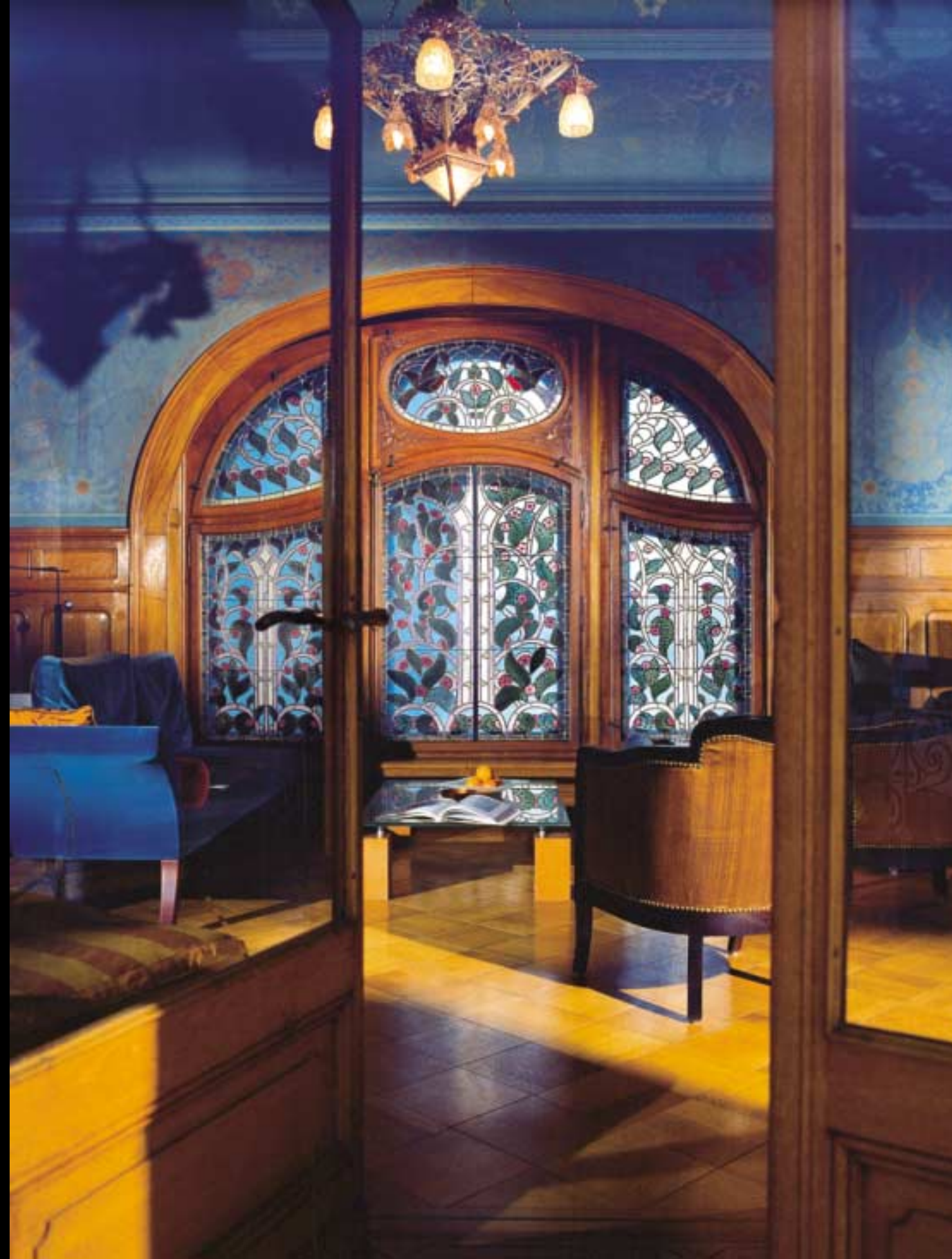
Harmonie respectée Ce fabuleux appartement, classé et restauré en 1994, jouxte l'atelier où travaillent ses propriétaires. Ils ont retrouvé le lustre d'origine signé Houriet et décoré de chauves-souris et de pinsons, chez un antiquaire biennois.