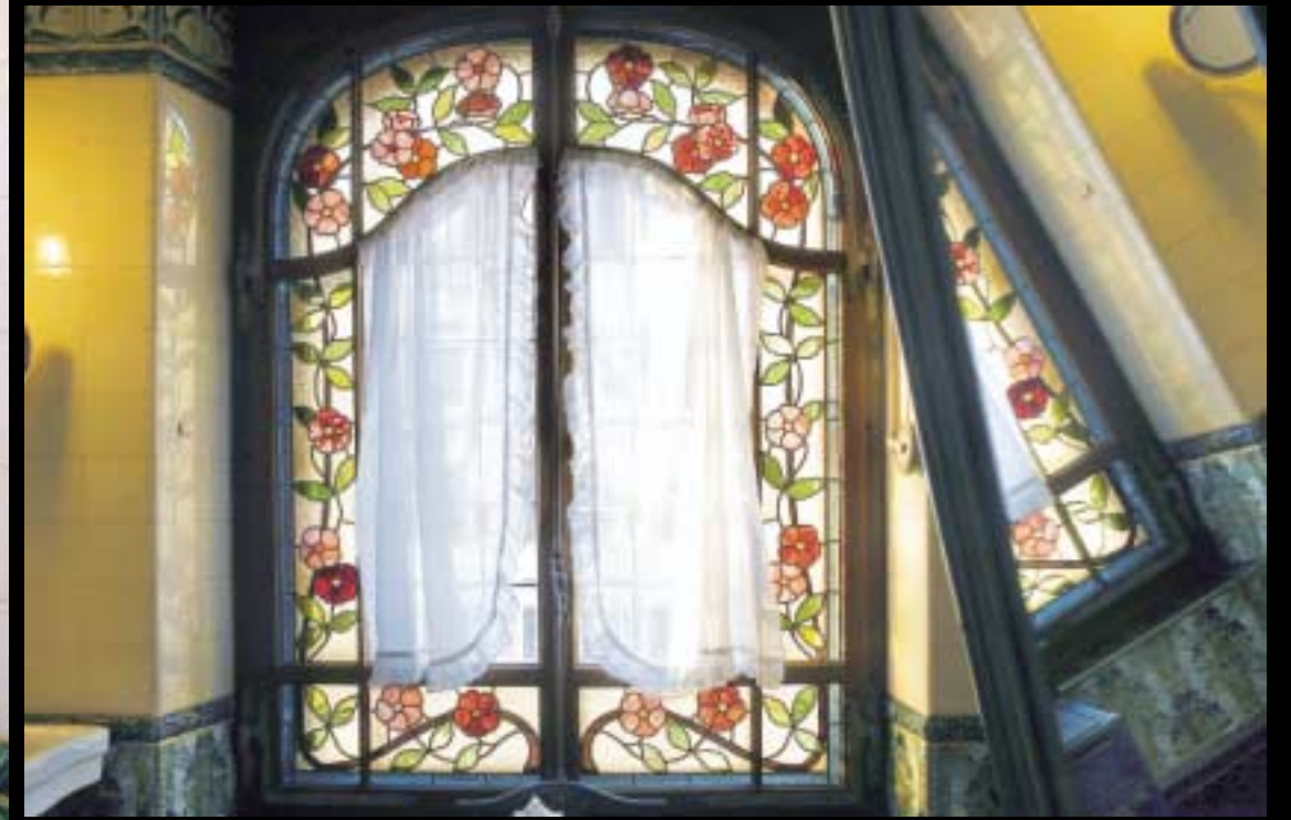
La salle de bain, classée, comporte un vitrail et de gracieux carreaux aux iris. Elle a gardé sa baignoire d'origine et même une sonnette qui servait à appeler la bonne quand Madame avait fini son bain.