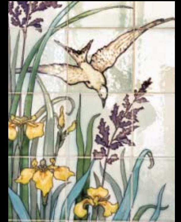
Construite en 1905 par Léon Boillot pour l'horloger Edmond Picard, la demeure mélange allégrement différents styles, mais conserve notamment une salle de bain et un vitrail typiquement Art nouveau.