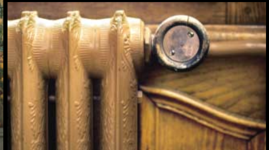
Les radiateurs n'ont pas échappé à l'emphase décorative. Astuce fréquente à cette altitude: une petite cagette permet de tenir ses pantoufles au chaud.