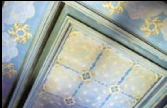
Le plafond, avec ses papillons et ses vols d'oiseaux, est signé André Evard.