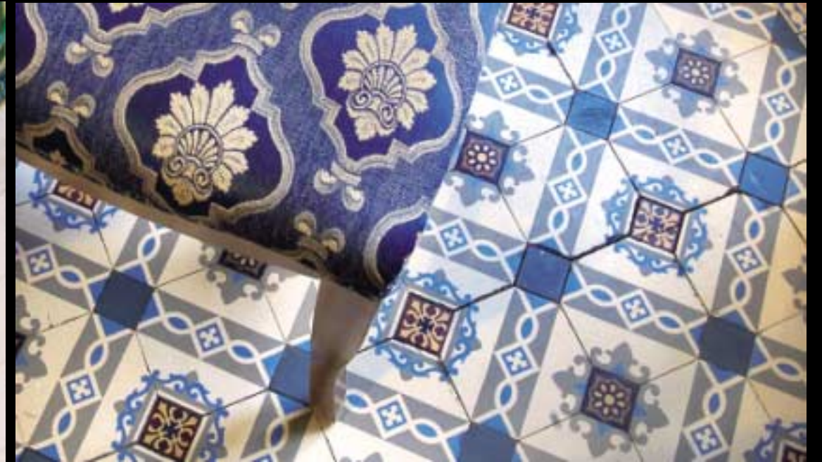
Le motif harmonieux du carrelage de la cuisine a trouvé ici un allié inattendu.