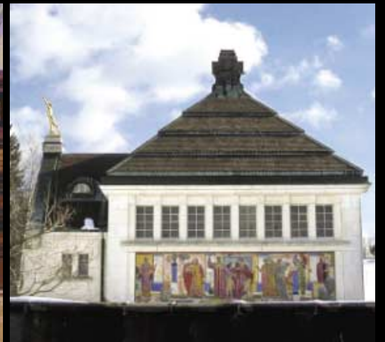
Chef-d'œuvre boudé Décoré par Charles L'Eplattenier, l'impressionnant Crématoire est un lieu parfait pour méditer. Il est encore en service, mais les Chaux-de-Fonniers préfèrent bizarrement célébrer leurs morts dans les modernes salons funéraires.